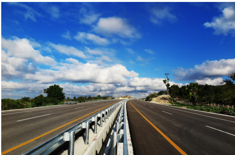
中铁国际中海外-中铁一局东帝汶联营体公司承建的苏艾高速公路项目

2013年以来，东帝汶利用世界银行、亚洲开发银行和日本政府贷款，对国内部分干线公路网络（“两横三纵”）进行整修。南部沿海目前作为东国家油气工业战略规划区域，正在建设一条高等级高速公路，全长155公里，分为4个标段分期建设。2013年7月，东帝汶南部海岸苏艾一比阿索高速公路项目第一标段（约30公里长）进行了公开招标，2015年初东帝汶向中国海外工程有限公司和中铁一局组成的联合体授标，合同金额2.98亿美元，工期2年。2018年11月17日，该高速公路一期项目正式通车。