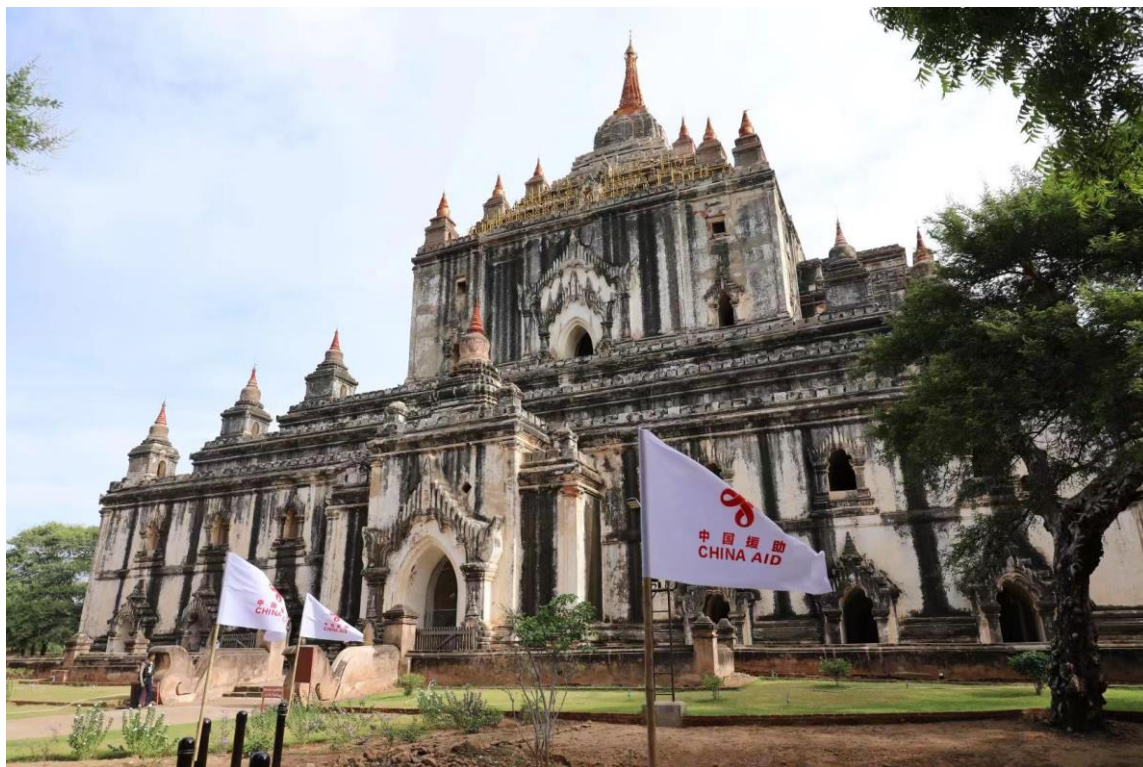
中方援助支持修复的蒲甘他冰瑜佛塔

85%以上的缅甸人信仰佛教，且十分虔诚，每天早晚均要念经一次，每逢缅历初一、十五或斋戒日都要到寺庙朝拜，布施钱财、物品。遇有红白喜事或过生日等，也常请僧侣到家供斋或到寺庙布施。佛教传入缅甸已有上千年历史，宗教思想已深入到社会生活的各个角落，扎根缅甸人民的思想体系。另外，缅甸约8%的人信奉伊斯兰教。