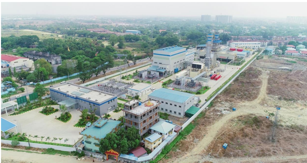
仰光达吉达天然气联合循环电站

目前，中资企业在缅投资主要集中在电力能源、矿业资源及纺织制衣等加工制造业等领域，投资项目主要采用BOT、PPP或产品分成合同（PSC）的方式运营。主要项目包括中缅油气管道、达贡山镍矿、蒙育瓦铜矿、瑞丽江一级水电站、太平江一级水电站、小其培水电站、迪吉燃煤电站、仰光达吉达燃气电站、皎漂燃气电站、阿隆燃气电站、海螺水泥、曼德勒光伏电站等。