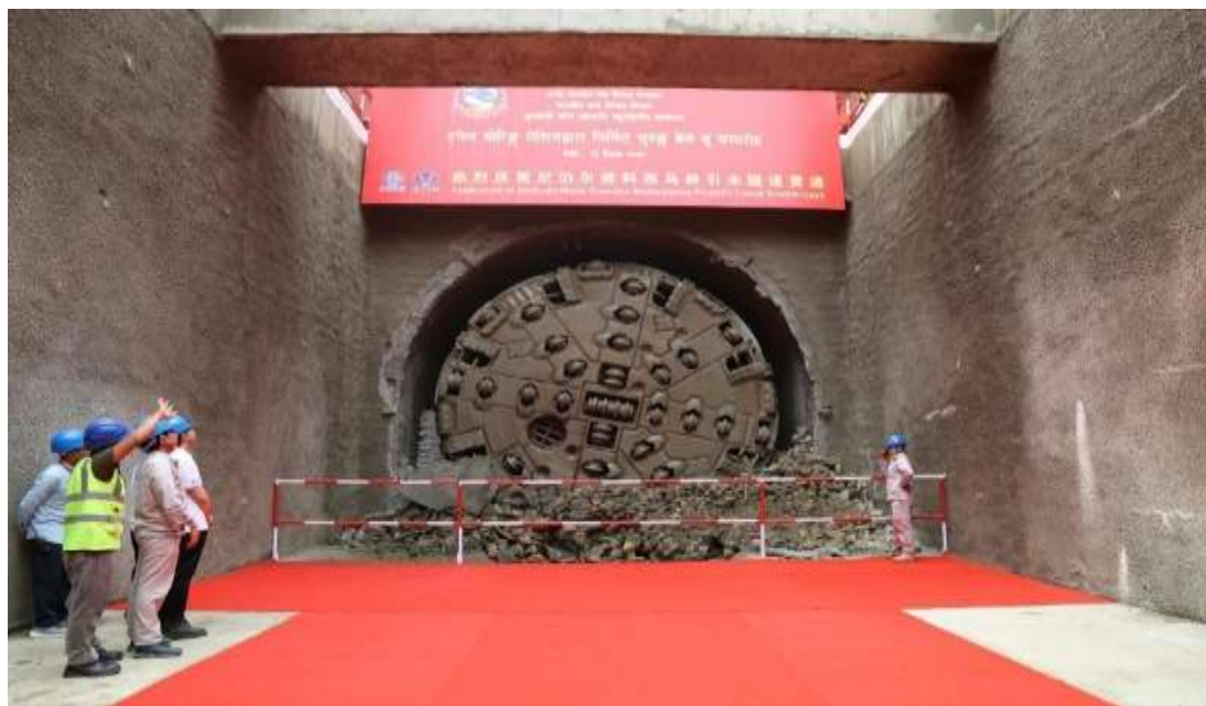
逊科西马林引水隧道项目

2024年5月8日，由中海外总承包，中海外、中铁二局共同实施的尼泊尔逊科西马林引水隧道项目主体隧道提前1年顺利贯通。尼泊尔逊科西马林引水隧道是全球首条穿越“西瓦里克+加德满都旋卷”地层的双护盾TBM隧道。该隧道全长13.3千米，建成后将逊科西河水引至马林河，灌溉德赖平原地区5个县共12.2万公顷农田。