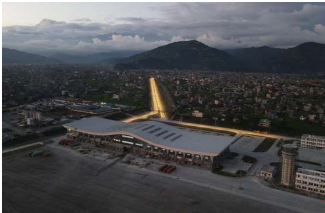
中国援助建设的博克拉国际机场

中国援助建设的博克拉国际机场位于尼泊尔中部旅游城市博克拉，于2023年1月1日投入运营。