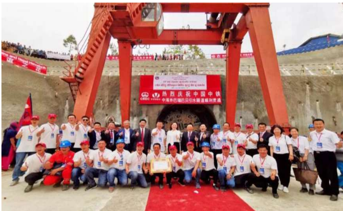
中海外巴瑞巴贝引水隧道项目顺利贯通

性最高的低喜马拉雅山脉西瓦里克地层巴瑞断裂带。该引水隧道项目是尼泊尔“国家骄傲”工程之一，主体隧道总长12.2千米。项目竣工后，可灌溉尼泊尔中西部和远西部交界处的巴迪亚和班克地区5.1万公顷的农田，并利用约150米的水位差异建造总装机容量为48兆瓦的发电站，为尼泊尔西部地区提供源源不断的电力，满足偏远地区民众的用电需求。2019年4月16日，隧道贯通。