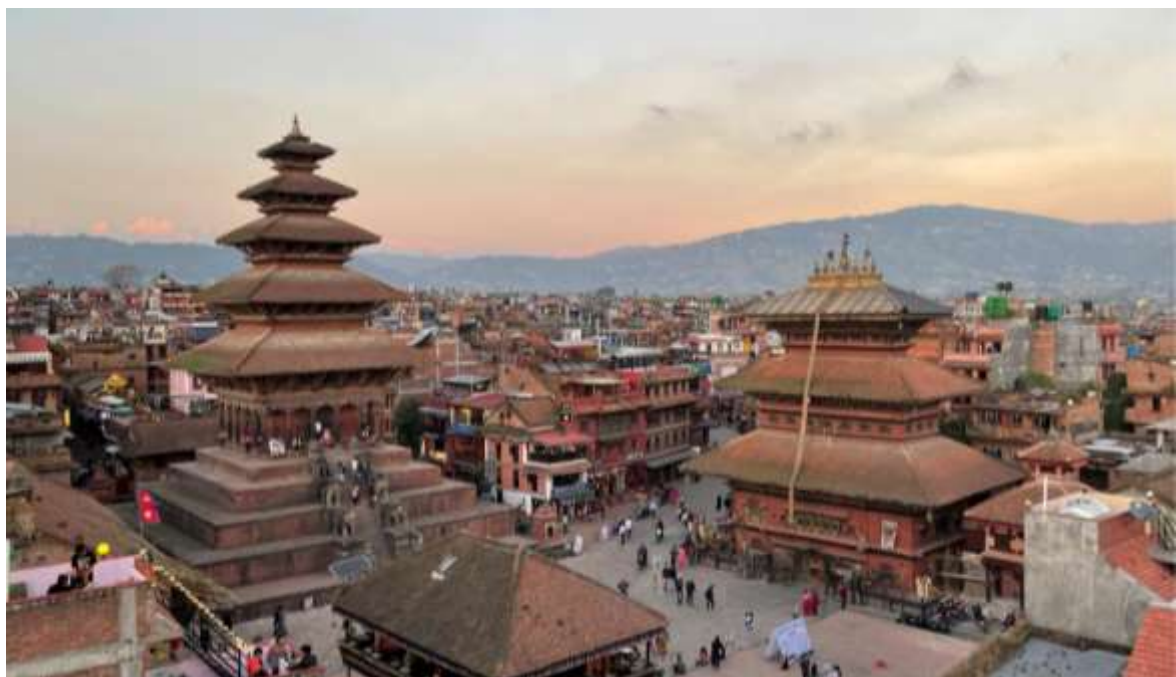
尼泊尔巴德岗杜巴广场

尼泊尔是一个多民族国家，全国有尼瓦尔 (Newar)、古隆 (Gurung)、拉伊 (Rai)、林布 (Limbu)、达芒 (Tamang)、马嘉尔 (Magar)、夏尔巴 (Sherpa)、塔鲁 (Tharu) 等130多个民族。