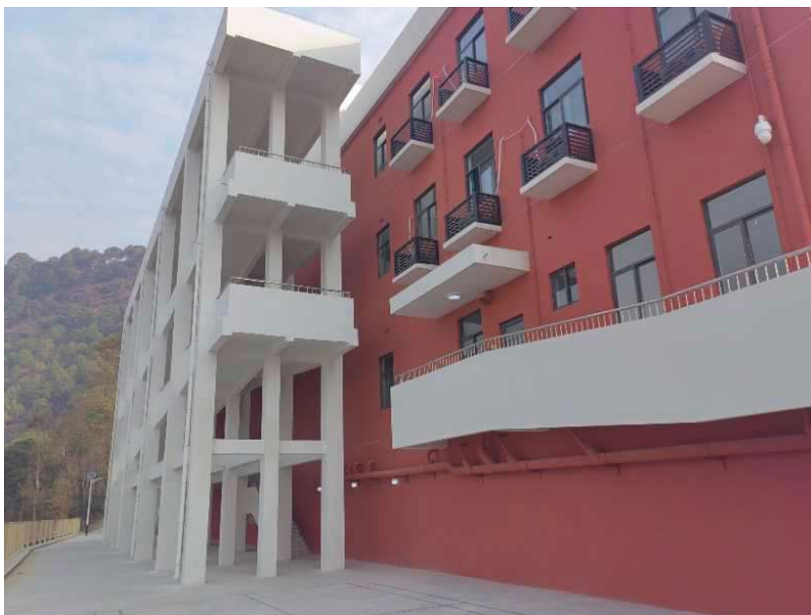
中国援建的辛杜巴尔乔克医院

2023/24财年，尼泊尔正努力解决发展项目资源短缺问题，其发展伙伴向该国提供的国际援助大幅减少。由于尼泊尔政府为实现税收目标方面面临挑战，发展计划因资源不足而受影响。据尼泊尔财政部发布的半年评估报告，2023/24财年前六个月的国际发展援助承诺比去年同期减少771.4亿卢比，仅为591.8亿卢比。尼泊尔政府一直在为卫生、交通、教育、农业、环境和经济发展筹集援助。在此期间收到的援助承诺中，卫生领域为166.5亿卢比，教育领域为86亿卢比，交通领域为152亿卢比，环境领域为34.5亿卢比，农业领域为26.6亿卢比，经济发展领域为8.25亿卢比。