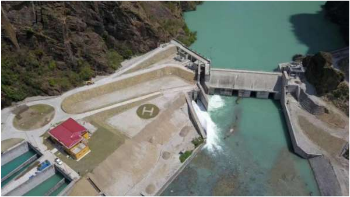
中国电建承建上塔马克西水电站项目

2022年4月12日，中国电建水电六局承建的尼泊尔迈拉穆齐引水项目成功通水。该项目是尼泊尔“国家骄傲”工程，出资方为亚洲开发银行，位于尼泊尔首都加德满都东部偏北约65公里处，项目分为大坝和引水隧洞两个标段，通水后，有效缓解了加德满都及周边区域饮用水短缺问题。