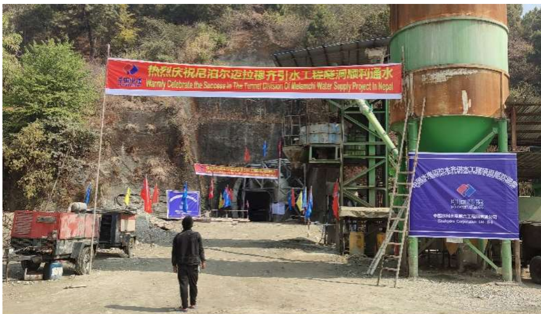
中国电建水电六局承建迈拉穆齐引水项目

2022年4月12日，中国电建水电六局承建的尼泊尔迈拉穆齐引水项目成功通水。该项目是尼泊尔“国家骄傲”工程，出资方为亚洲开发银行，位于尼泊尔首都加德满都东部偏北约65公里处，项目分为大坝和引水隧洞两个标段，通水后，有效缓解了加德满都及周边区域饮用水短缺问题。