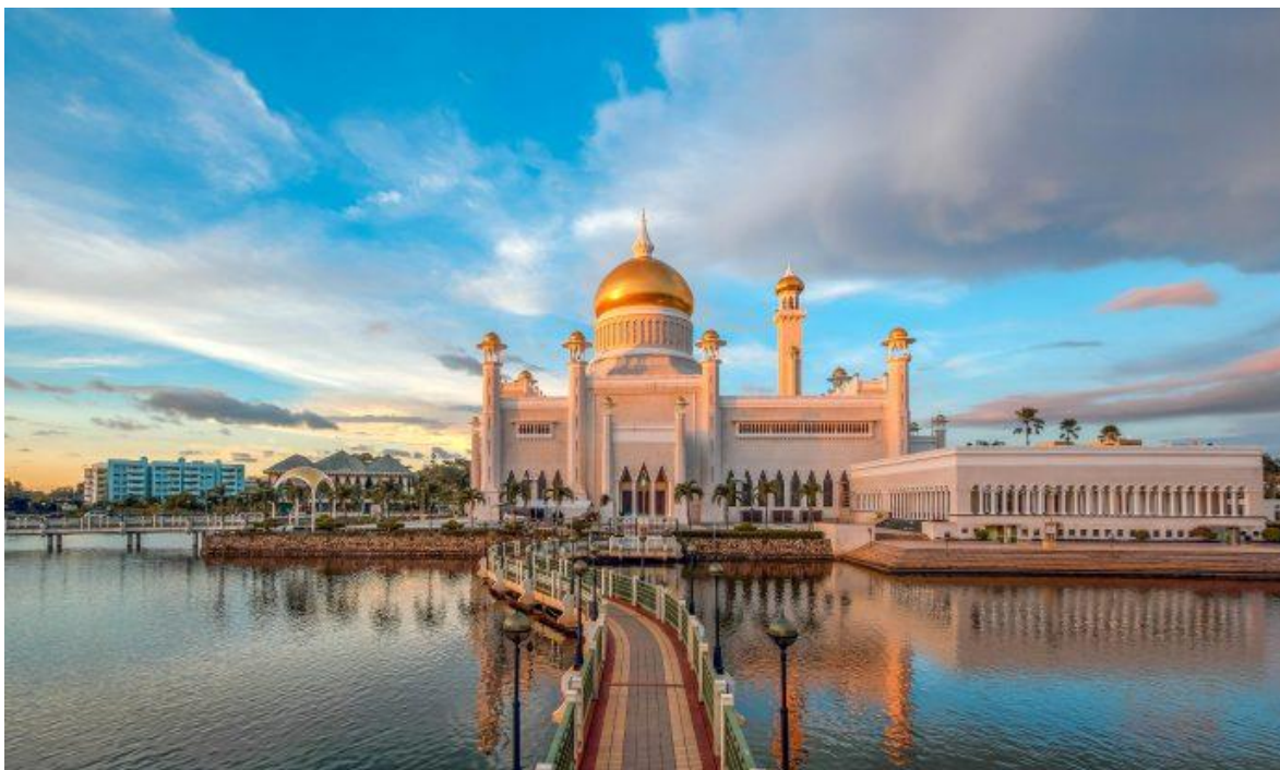
苏丹奥马尔·阿里·赛福鼎清真寺

独立以后，苏丹政府大力推行“马来伊斯兰君主制”（MIB），巩固王室统治，重点扶持马来族经济，在进行现代化建设的同时严格维护伊斯兰教义。