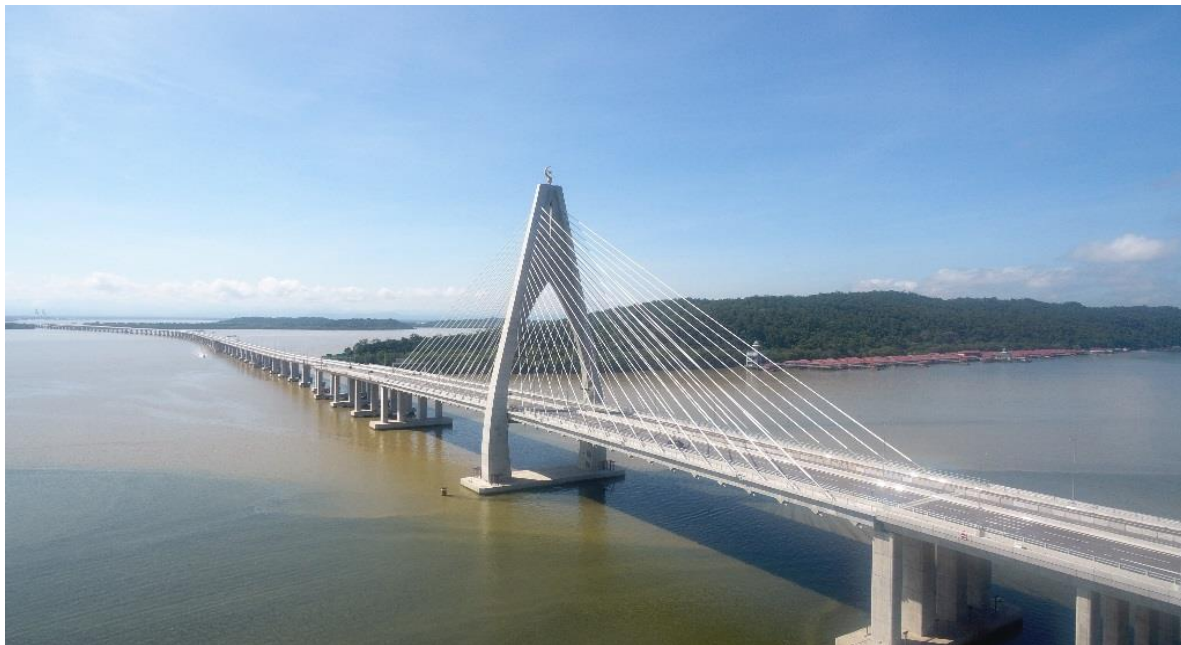
中资企业参与承建的文莱淡布隆跨海大桥