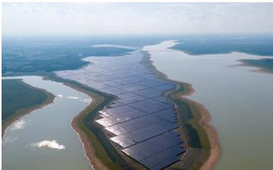
越南油汀太阳能电站

同时，中资企业承建了越南大部分光伏电站项目，如中国电建集团参与越南22个光伏电站建设，承包工程合同额14.38亿美元。其中，由越南春桥公司与泰国B.GRIMM电力公司共同投资开发，中国电建协助业主完成融资并总承包的越南油汀太阳能电站于2019年6月正式投入商业运行，项目装机容量近500MWp，采用中国技术、中国设备、中国标准，为东南亚地区功率最大的太阳能电站。