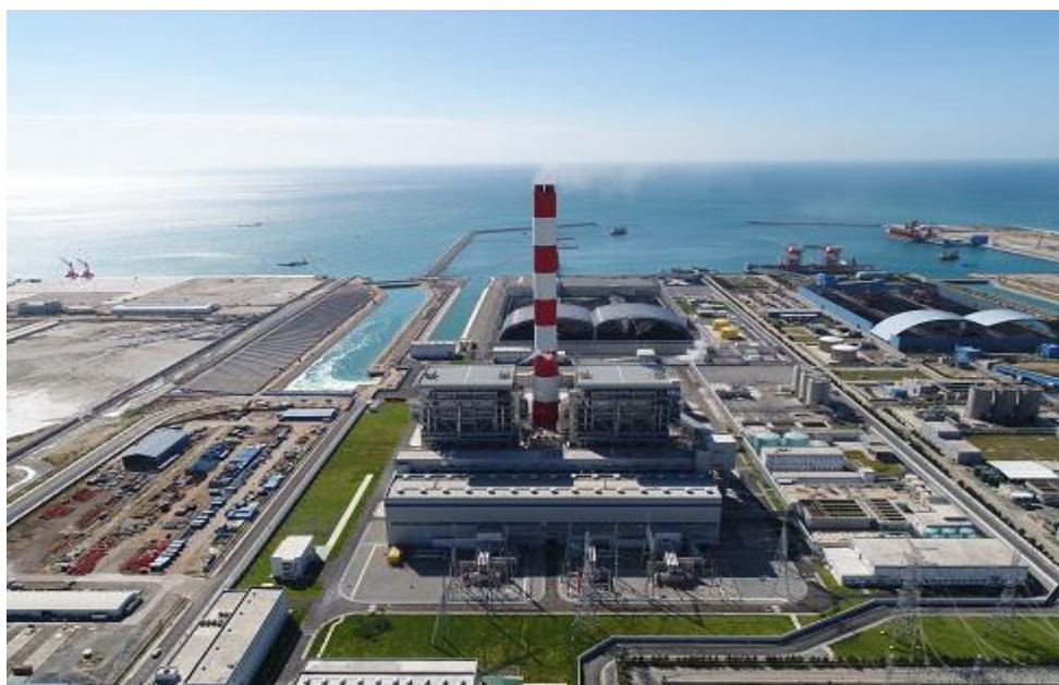
永新一期燃煤电厂

(1) 永新一期燃煤电厂BOT项目。位于平顺省，总投资17.55亿美元，项目总装机容量124万千瓦（两台62万千瓦机组），年发电量约80亿度，由中国南方电网公司、中电国际公司、越南煤炭与矿产工业集团下属电力总公司三家企业合资承建，南方电网持有电厂55%股份，中电国际持有40%股份，越南煤炭矿业工业集团公司持有5%股份。2018年11月全线投产，特许经营期25年。