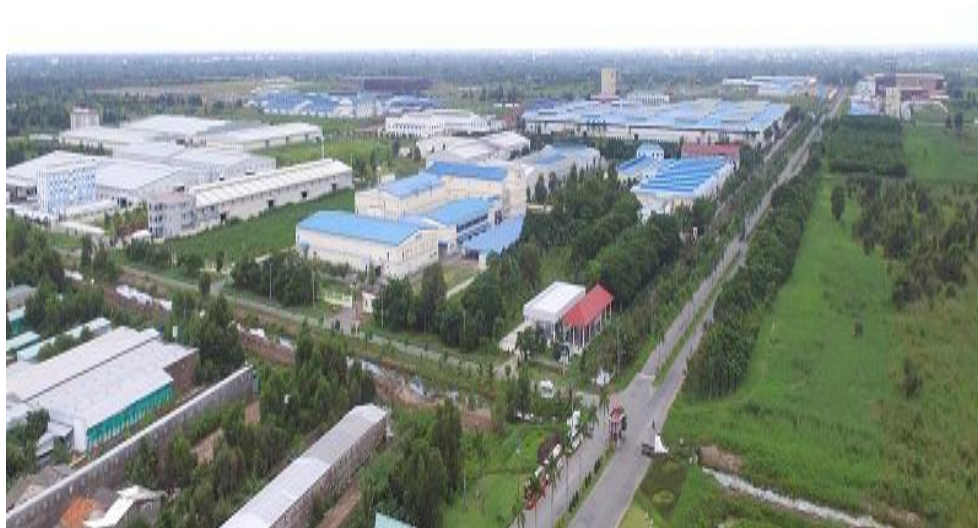
前江省龙江工业园

中，铃中出口加工区已实施三期项目，效果较好，成为越南工业区建设典范。龙江工业区是通过中国商务部和财政部考核确认的境外经贸合作区，有利于推动中国企业“集群式”走出去，扩大对越南投资合作规模。海河工业区位于越中边境，核心行业为纺织，园区建设起点高、规模大。