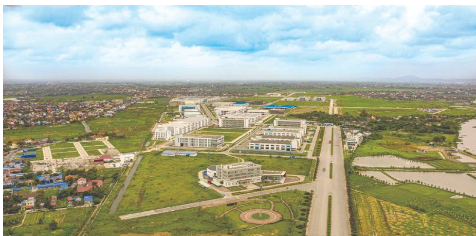
海防市深越工业园