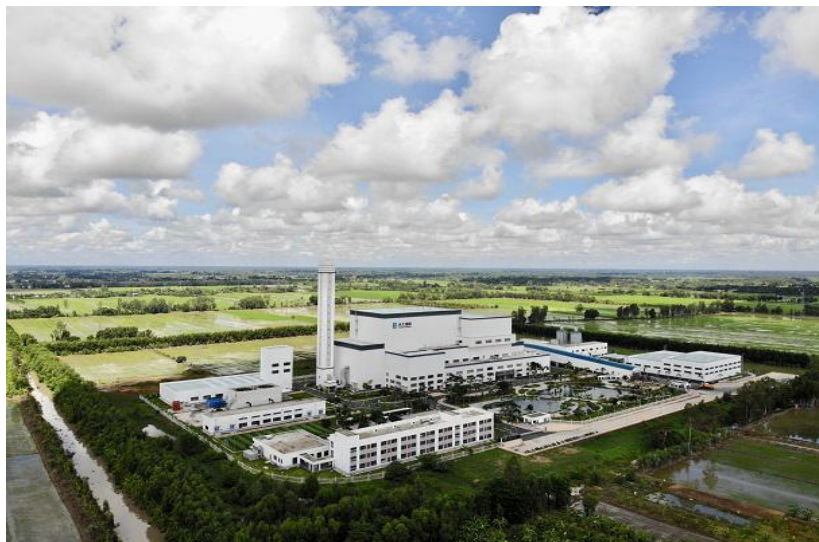
芹苴垃圾发电项目

河内朔山垃圾焚烧发电项目已于2022年7月正式投入运行。项目由天楹集团投资，中国一冶集团有限公司承建。项目总投资额约3.2亿美元，日处理生活垃圾4000吨，是越南最大的垃圾发电站。