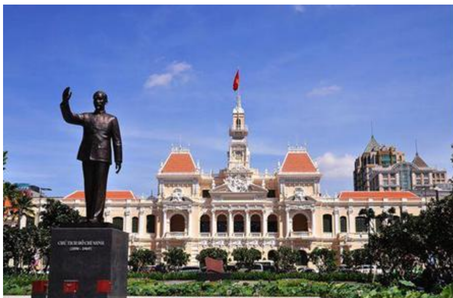
胡志明市人民委员会驻地

胡志明市是越南最大的港口城市和经济中心，面积2090平方公里，2022年人口910万人，由原西贡、堤岸、嘉定三市组成，位于湄公河三角洲东北，西贡河右岸，距离出海口60公里。据越南官方统计，胡志明市华人约50万，市内第五郡（原堤岸市）是华人聚居区。市内有多处历史建筑，包括统一宫（原南越总统府）、市政厅、邮局、歌剧院、天后庙、圣母大教堂等。胡志明市气候终年炎热，昼间温差不大。1月份气温最低，月平均气温25℃；4月份最高，月平均气温29℃。