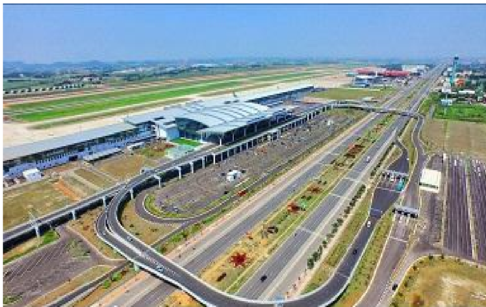
河内内排国际机场

越南民航主要机型为空客（320型、321型、330型、350型）和波音（737型、767型、777型、787型）。目前民用客机数量约190至210架。除越南6家本土航空公司外，还有25个国家的68家外国航空公司经营越南国际航线，已开通联接国内20多个城市与中国、韩国、日本、美国、泰国、马来西亚、俄罗斯、德国、澳大利亚、法国、英国、印度等28个国家的130多条航线。