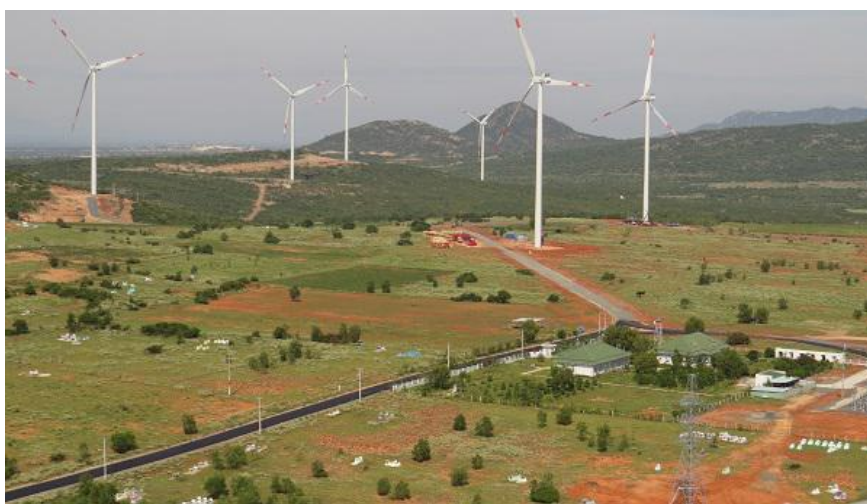
越南富叻风电项目

【风电领域】据不完全统计，中资企业已在越投资或承建了近70个风电项目，设计装机容量3.3GW。