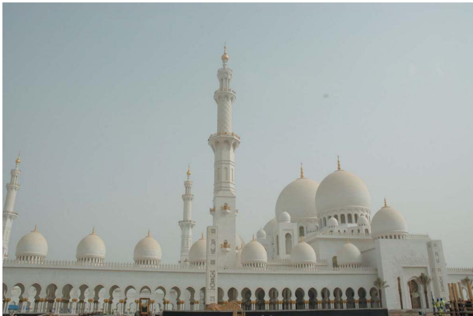
谢赫扎耶德清真寺

阿联酋是阿拉伯国家之一，国人信奉伊斯兰教，有着独特的生活方式、文化风俗和文化禁忌。