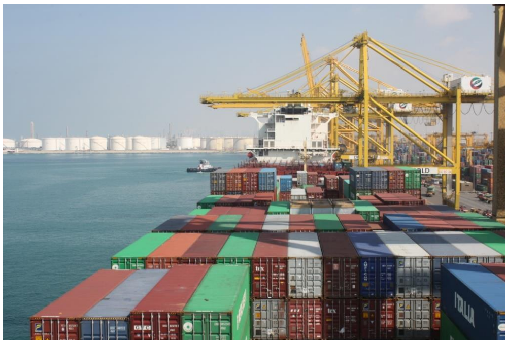
杰贝阿里集装箱码头

杰贝阿里港位于杰贝阿里自由区内，系世界最大的人工港，码头长15公里，有67个泊位，拥有世界一流的配套设施和服务。杰贝阿里港在2023年处理了1447万标准箱，集装箱吞吐量居世界前十位，是中东北非地区第一大港，连续多年荣获中东最佳港口奖。