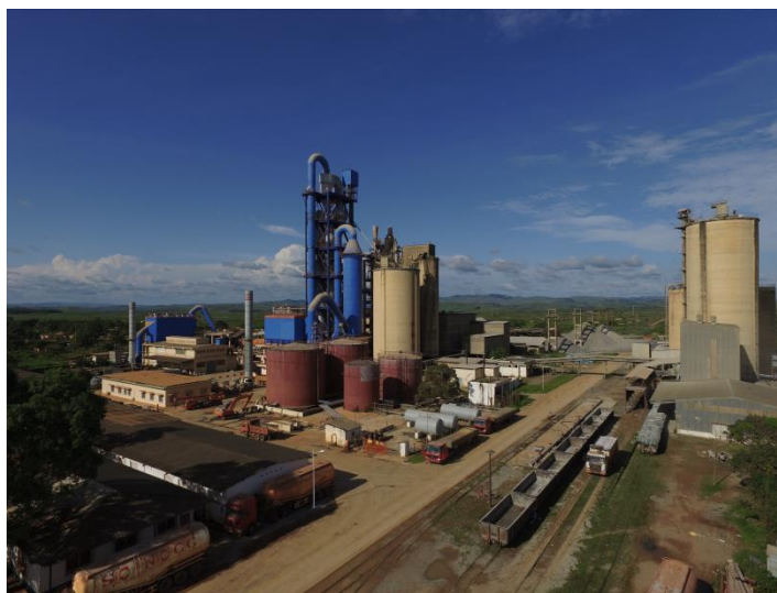
中国路桥与刚方合资建成年产30万吨刚果新水泥厂

工业园特许经营权交由卢旺达Crystal Ventures Ltd.公司。刚果（布）新水泥厂及中国Forspak国际水泥厂已分别于2004年和2013年投产,设计年产能均为30万吨,其中刚果(布)新水泥厂为中刚合营企业。据悉,目前刚果(布)现有3家水泥生产企业在运营,分别是中刚合资的刚果(布)新水泥厂(Sonocc)、中国Forspak水泥厂和尼日利亚丹格水泥厂。目前,印度正在尼阿里省修建一家名为Tao-Tao的水泥厂,预计2025年竣工,设计年产能60万吨。