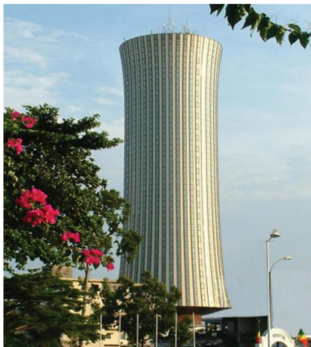
政府办公楼（当地称作“腰鼓楼”）