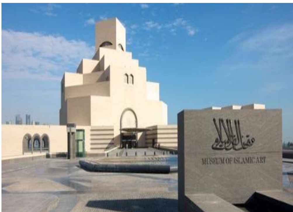
多哈伊斯兰艺术博物馆

【产业中心】位于北部的拉斯拉凡工业城和南部的梅赛义德工业城是卡塔尔石油化工和天然气液化产业中心。