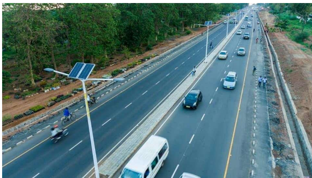
山东路桥承建的援马拉维首都机场M1公路

马拉维是内陆国家，交通运输以公路为主，公路承载了国内70%以上的货运和99%的客运，以及75%的国际货运。全国公路总长2.55万公里，其中沥青等铺装路4690公里（马财政部2021年度经济报告数据）。马公路网与莫桑比克、坦桑尼亚、赞比亚、津巴布韦、博茨瓦纳及南非的公路连接。全国城际主干道少、等级低，无高速公路，多为双向两车道，从布兰太尔经利隆圭到姆祖祖，纵横南北的M1公路为马最重要的交通动脉。城市主干道和机场路高峰时期拥堵，需改造提升。马拉维国家道路管理局数据显示，该国超过一半的道路在建设或维护中，比如，由欧洲投资银行（EIB）提供贷款，中资企业和葡萄牙企业正在修建301公里长的M1公路改扩建项目；由我提供援款，山东路桥承建我援马首都机场M1公路升级改造项目，计划2024年底竣工。