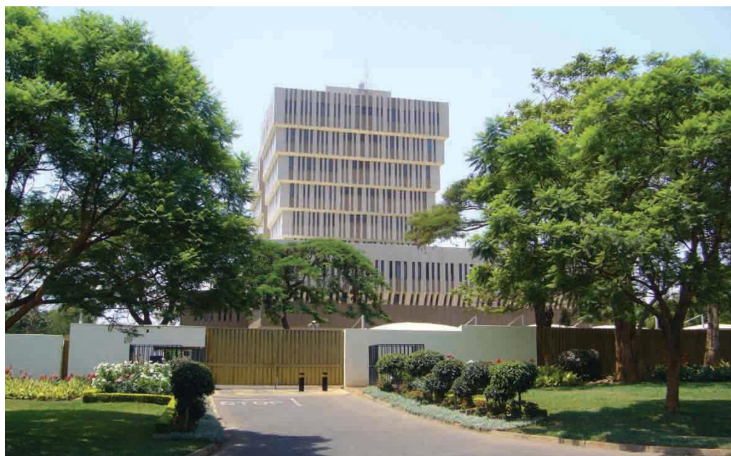
马拉维储备银行总部大楼

【中央银行】马拉维储备银行（RBM）是马拉维中央银行，负责制定货币政策和银行业务监管。