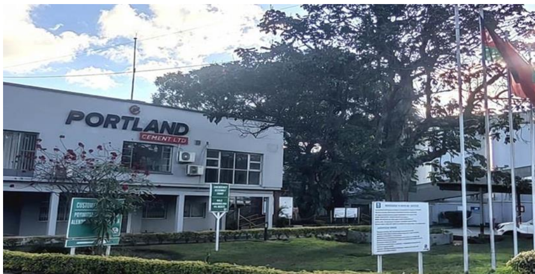
华新水泥投资的马拉维波特兰水泥公司

程细则需由私人律师编写。本地公司注册费用5万克瓦查，外国公司注册费用10万克瓦查，支付律师的费用30-50万克瓦查。公司注册一般需要10个工作日。公司注册手续完成后，便可分别到贸工部和税务局申请营业许可和税务登记号，以及到商业银行开立银行账户。