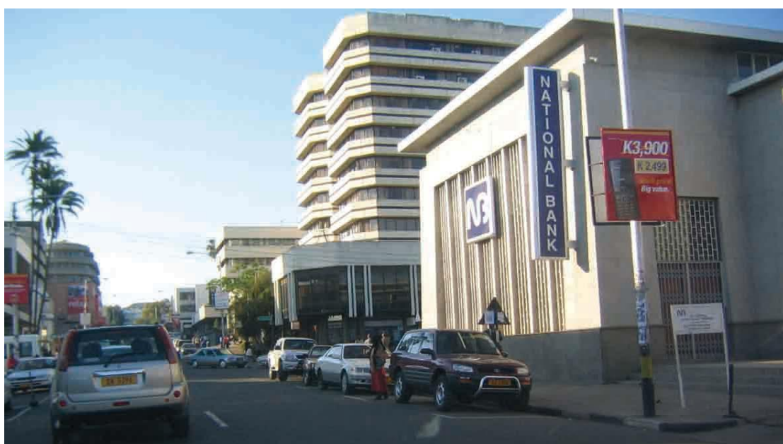
马拉维布兰太尔市商业街

马拉维经济不发达，物资匮乏，近年通胀严重，居民实际生活成本较高。据主要超市数据，目前，每公斤玉米粉、面粉、大米价格分别约0.8美元、2.3美元、1.8美元；每公斤牛肉、羊肉价格分别约6.3美元、5.4美元；每公斤土豆、西红柿价格分别约2.3美元、0.9美元；每公升牛奶、食用豆油价格分别约1.9美元、3美元；每10个鸡蛋约1.7美元。