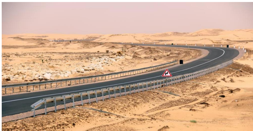
Atar-Tidjikja公路第三标段项目