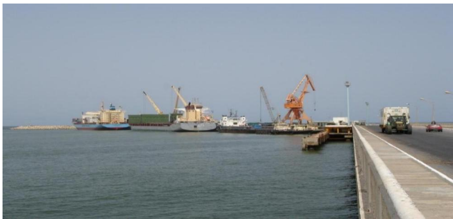
中国援建毛友谊港码头

位于首都以北约60公里处的塔尼特渔港是毛政府投资修建的唯一一座专业渔港，该项目由中国电建集团港航建设有限公司承建，2020年交付使用，拥有电力、网络、燃油供给设施、海水淡化及制冰设施、鱼产品交易场所、生活办公及港口管理等配套设施。