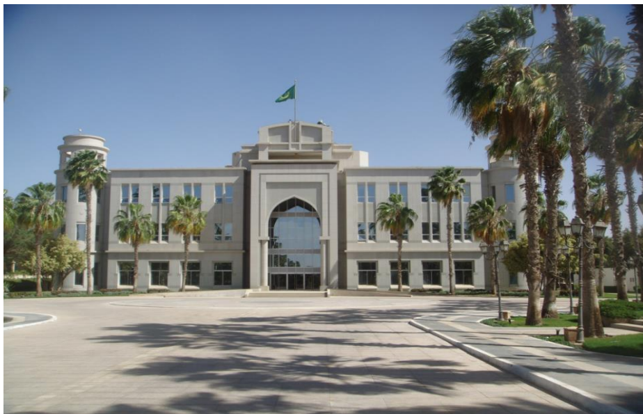
毛里塔尼亚总统府