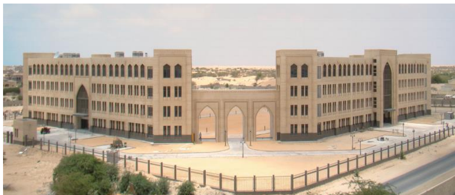
毛里塔尼亚外交部和经济部

从地理、文化、社会等方面看，毛既是阿拉伯国家，又是非洲国家，被称为阿拉伯—非洲之桥。因此，它兼有阿拉伯和非洲的风俗习惯。