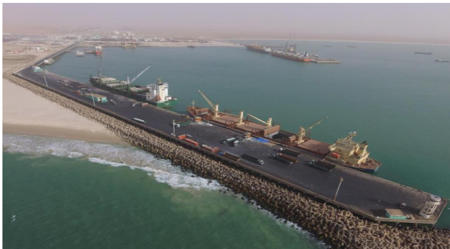
投入使用的友谊港1、2、3#泊位