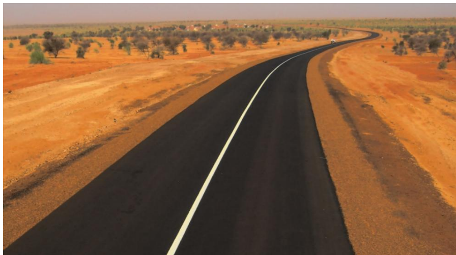
罗索—博盖公路2标段，全长94公里