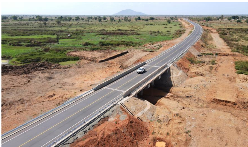
朱巴至特里卡卡镇公路

南苏丹政府计划建设总里程超过4000公里的新公路，届时公路网络将遍布全国，发展成交通运输走廊。2019年3月，在南总统基尔的见证下，山东高速与南路桥部、财政部、石油部签署了朱巴至伦拜克道路升级改造项目的EPC总承包合同及多方协议，合同金额7.3亿美元，目前项目完成63公里施工。受南财政制约，项目目前处于停工状态。关于道路的通行能力和不同季节性的通行条件，可访问联合国联合物流中心网站南苏丹版块： www.logcluster.org/ops/sudan 。