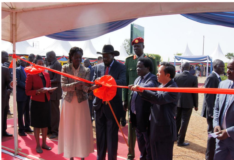
华为公司南苏丹国家宽带项目开工仪式