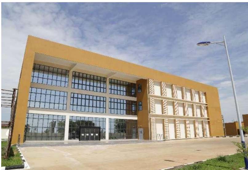
南苏丹空中交通管理系统工程项目