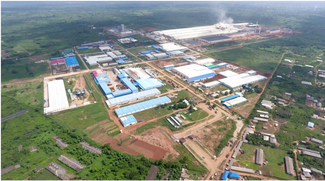
奥贡自贸区航拍图