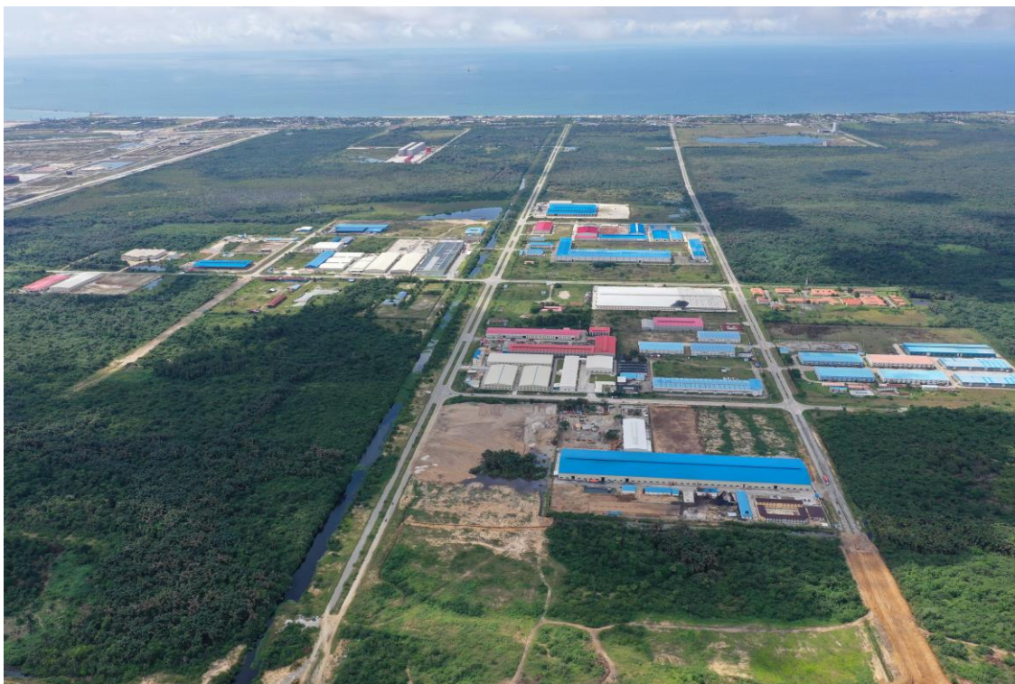
莱基自贸区航拍图

和支持的“境外经贸合作区”。截至2024年5月，共有签订协议企业119家，在运营和建设企业75家。产业范围涉及钢铁建材、制造业、家具组装和服装贸易等。