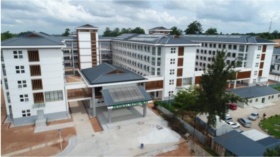
中国援赞比亚利维·姆瓦纳瓦萨教学医院项目

中国援建的赞比亚移动医院于2011年5月交付使用，为偏远地区人民提供了大量医疗服务。为更好地促进移动医院的运营，赞比亚卫生部专门成立了移动医疗及应急救援司，负责促进移动医疗服务。