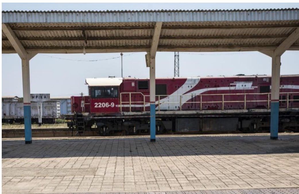
坦赞铁路姆皮卡站-站台火车

2023年，赞比亚铁路运输货物总量为94925公吨，承担货运总量的29.6%左右。目前，赞比亚境内有三条主要铁路，一条是连接赞比亚和坦桑尼亚的坦赞铁路，赞比亚境内运营里程约为886公里；一条是赞比亚铁路，运营里程约为1280公里；还有一条是赞比亚和马拉维共同建设的奇帕塔-姆钦吉铁路，连接两国的边境城市—赞比亚的奇帕塔和马拉维的姆钦吉，并最终连接至莫桑比克的纳卡拉港。