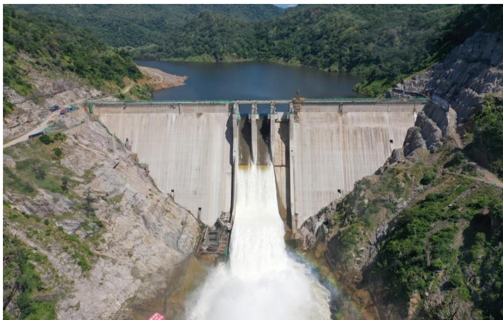
凯富峡水电站大坝