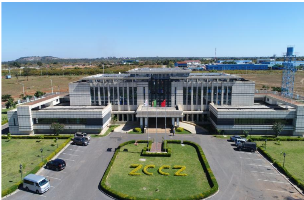
赞比亚中国经济贸易合作区

【赞比亚中国经济贸易合作区】2007年2月成立，是中国在非洲设立的第一个经贸合作区，也是赞比亚政府宣布建设的第一个多功能经济区。合作区总规划面积17.19平方公里，由谦比希园区和卢萨卡园区组成。截至2023年2月，合作区累计直接投资2.4亿美元，吸引投资额26.12亿美元，累计产值255.75亿美元，入园企业82家，涉及采矿、勘探、冶炼、有色金属加工、化工制造、农业、建筑、贸易、物流、制药等行业。