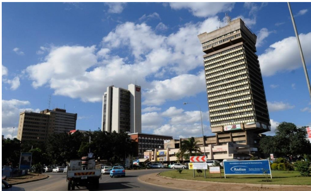
赞比亚卢萨卡市中心