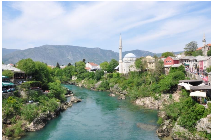
莫斯塔尔市的内雷特瓦河畔风光

其他主要城市有图兹拉（煤电和化工业）、泽尼察（钢铁产业）、多博伊（农业及食品加工）。