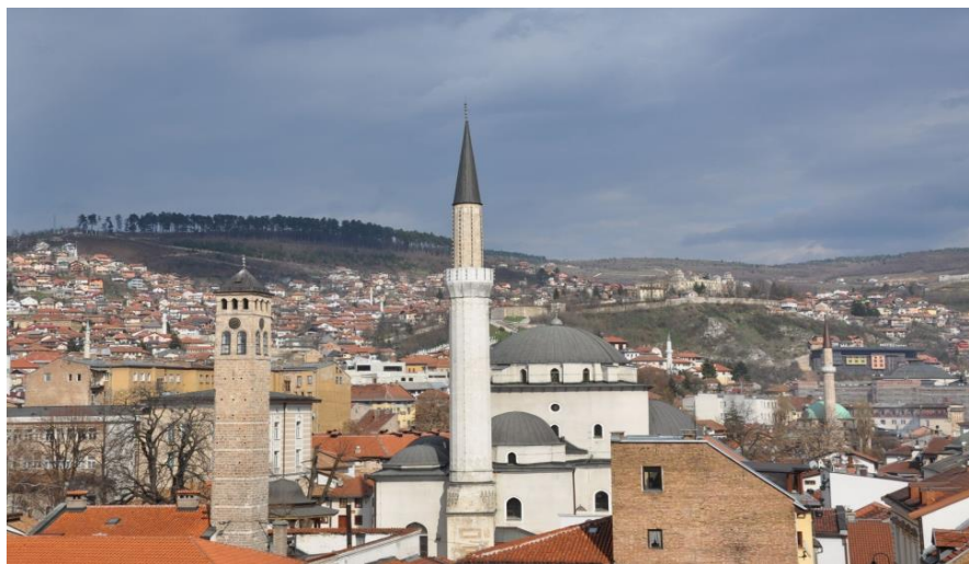
萨拉热窝市中心的贝戈瓦清真寺

波黑极具特色的大众传统风味小吃：一是“切瓦比”（一种牛羊肉丸拌洋葱夹面囊饼）；二是布雷克馅饼。