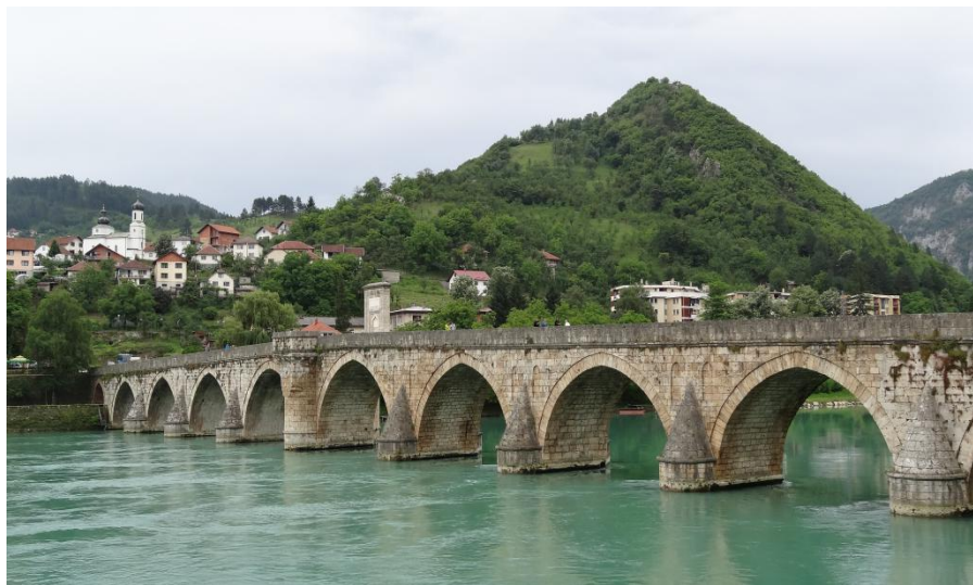
波黑维舍格勒老桥

波黑希望继续加强与中国的旅游合作，商签旅游合作协议，实现双边旅游往来的常态化，同时欢迎中国企业对波黑的旅游设施项目进行投资。