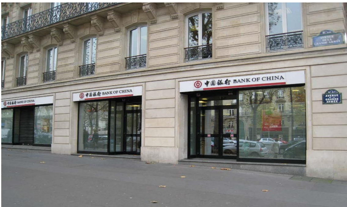
中国银行巴黎分行

【外资银行】 主要外资银行有：汇丰银行（HSBC）、巴克莱银行（Barclays）、德意志银行（Deutsche Bank）、苏格兰皇家银行（RBS）、瑞银集团（UBS）。