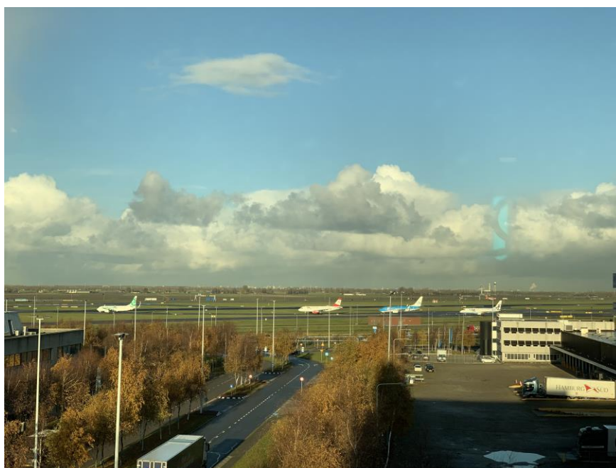
阿姆斯特丹史基浦机场

塔等城市有4个中央政府管理的机场，主要停靠往返于欧洲地区国家的廉价航班；登海尔德和埃因霍温有两个军民两用机场；此外，还有12个省级政府管辖的小型民用机场。