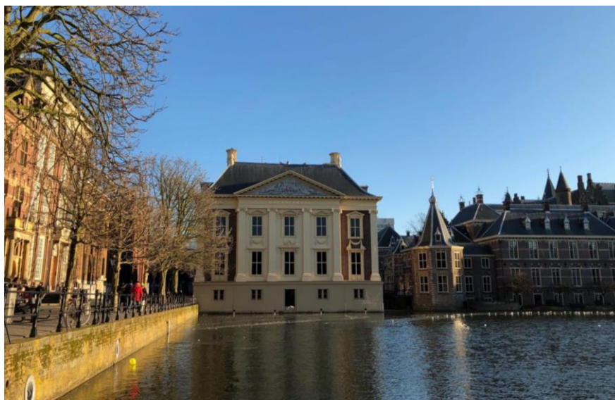
海牙莫里茨博物馆

荷兰1463年正式成为国家，16世纪前长期处于封建割据状态。16世纪初受西班牙统治，1568年爆发延续80年的反抗西班牙统治的战争。1581年北部七省成立荷兰共和国（正式名称为尼德兰联省共和国）。1648年《威斯特伐利亚和约》的签署使西班牙正式承认荷兰独立。17世纪被誉为荷兰的“黄金时代”，荷兰成为海上殖民强国，经济、文化、艺术、科技等各方面均非常发达。18世纪后，殖民体系逐渐瓦解，国势渐衰。1795年被法军入侵，1810年并入法国，1814年脱离法国，翌年成立荷兰王国（1830年比利时脱离荷兰独立）。1848年成为君主立宪国。第一次世界大战期间保持中立。第二次世界大战初期，荷兰宣布中立。1940年5月被德国军队侵占，王室和政府迁至英国，成立流亡政府。1945年恢复独立，战后放弃中立政策，加入北约和欧共体及后来的欧盟。