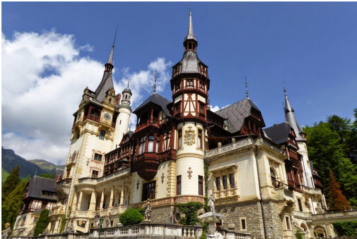
罗马尼亚佩列什王宫