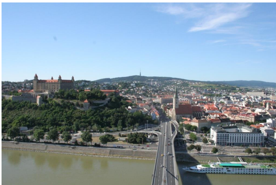
首都布拉迪斯拉发

1993年1月1日，斯洛伐克共和国成为独立主权国家并于1993年2月加入联合国教科文组织、世界卫生组织；1995年1月加入世界贸易组织；2000年加入经济合作与发展组织；2004年3月加入北约，5月加入欧盟；2007年12月加入申根区；2009年1月加入欧元区。斯洛伐克还是中东欧地区组织维谢格拉德集团的成员国。