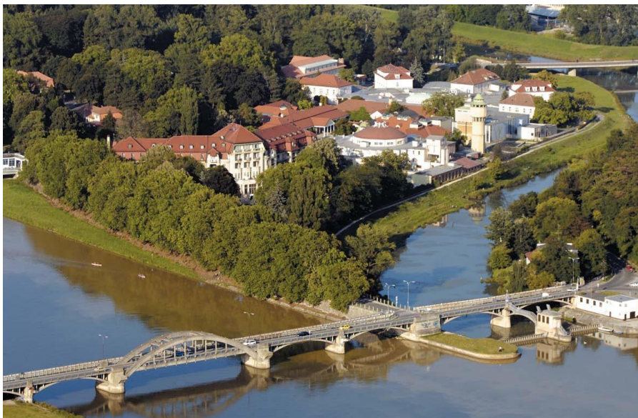
皮耶什佳尼温泉中心

【医疗】斯洛伐克公民可以通过参加公共健康保险获取免费的医疗和保健服务。其医疗保险制度规定，除无经济能力的公民（包括失业者、退休者、学生、儿童、军人和残疾人）的医疗保险金由国家支付外，其他人员须缴纳一定数量的医疗保险，医保范围包括牙科服务费、住院看护费、疗养费、药费、医疗费以及因医疗发生的交通费及运送费。斯洛伐克目前有5家医疗保险公司，其中综合保险公司规模最大，覆盖斯洛伐克大多数国民。