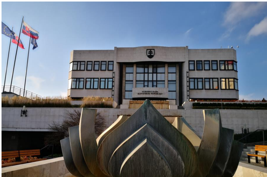
斯洛伐克议会大厦

委员会、文化和媒体委员会、外交委员会、教育、科学、青年和体育委员会等19个委员会。2024年4月6日，彼得·佩列格里尼当选斯总统，随即依法停止履行议长职权，副议长彼得·日加任代理议长。6月9日，副议长鲁博什·布拉哈当选欧洲议会议员，于6月25日辞去副议长职务。6月27日，议会国防与安全委员会主席蒂博尔·加什帕尔（Tibor Gašpar，方向党籍）当选新任副议长。