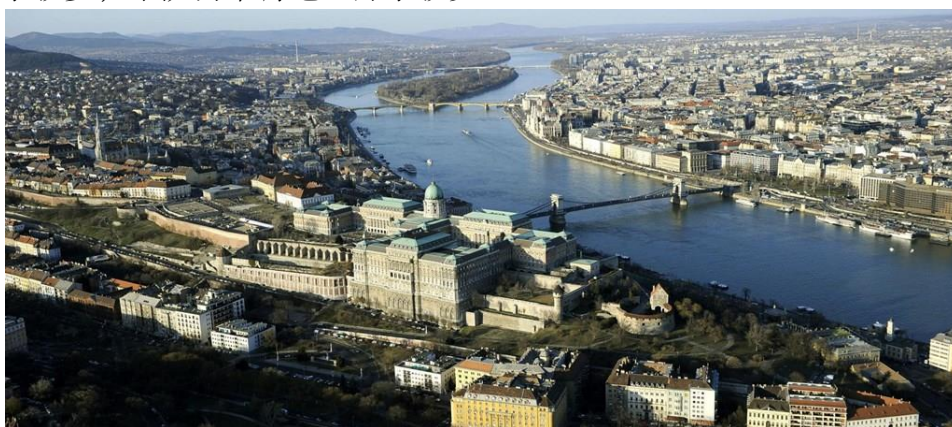
俯瞰布达佩斯多瑙河两岸

匈牙利全年比较干燥，降水较少。近年尤为干旱，2022年平均降水量497毫米，2024年7月降水量仅为22.2毫米，远低于1991至2020年期间的71.8毫米平均值。西部地区降水较多，蒂萨河中游地区降水较少。