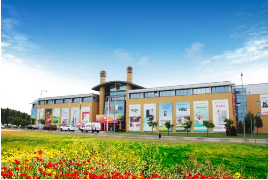
中欧商贸物流合作园区

【中国匈牙利宝思德经贸合作区】中国匈牙利宝思德经贸合作区是由万华实业集团有限公司主导开发的以化工、轻工、机械制造、物流等为核心产业的加工制造基地。目前，园区拥有工业用地4.8平方公里，入驻15家企业。该园区前身为匈牙利宝思德（BC）公司工业园，1997年获得匈牙利政府批准，2011年万华实业收购BC公司100%股权项目后改为中国匈牙利宝思德经贸合作区，经营业绩持续改善，于2014年成功扭亏为盈。为表彰中国企业为当地做出的杰出贡献，2018年匈牙利卡津茨鲍尔茨卡市政府出资在市政厅广场树立起中国龙。2023年，园区完成年销售收入25.4亿欧元，为当地提供就业岗位约3300个。