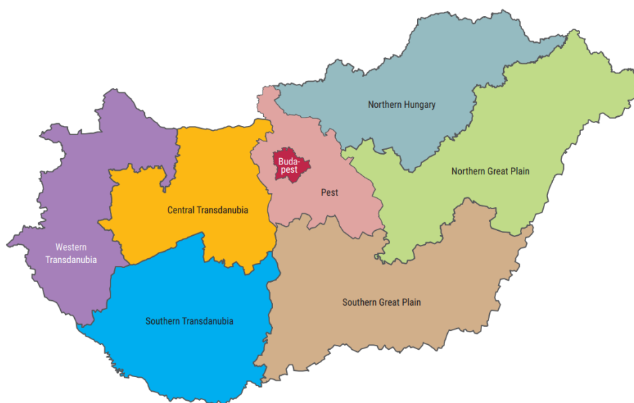
匈牙利7个统计规划区域(来自匈牙利中央统计局Reginal Atlas)

Hungary)、北部大平原(匈语: Észak-Alföld, 英语: Northern Great Plain )和南部大平原(匈语: Dél-Alföld, 英语: Southern Great Plain)。