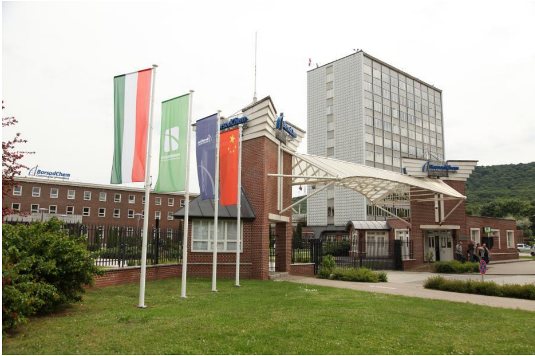
中国匈牙利宝思德经贸合作区