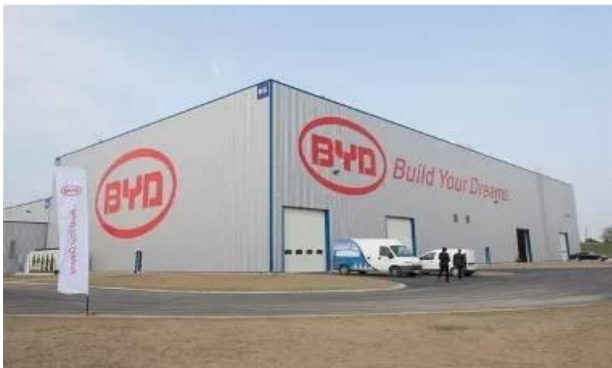
比亚迪电动大巴匈牙利工厂

在匈投资的主要中资企业包括：烟台万华集团、华为、中兴通讯、中欧商贸物流合作园区、比亚迪、延锋汽车、通用国际、山东豪迈、安徽丰原、联想集团、上海电力、南京泉峰、云南恩捷、宁德时代、汇川技术、亿纬锂能、华友钴业、欣旺达等。自2020年起，中资企业在匈绿色能源和新能源汽车产业领域的投资大幅增加。