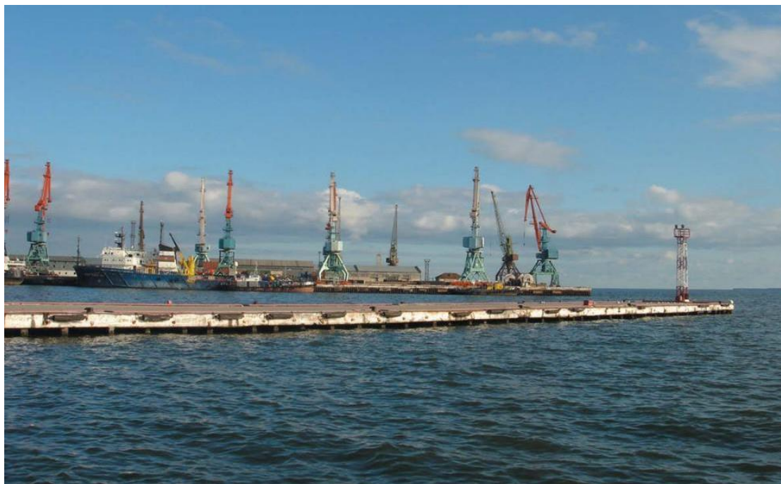
巴库港——里海最大港口