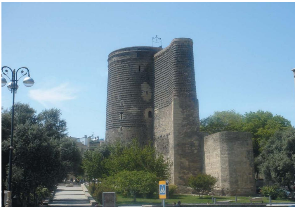
巴库最著名的古迹、世界文化遗产——少女塔

阿塞拜疆居民主要信奉伊斯兰教（什叶派），但不强调教派间差异。俄罗斯、亚美尼亚、格鲁吉亚等少数民族信奉基督教。穆斯林重要节日如“古尔邦节”“开斋节”“纳乌鲁兹节”（春节）以及俄罗斯、东欧节日等都是法定公众假日。