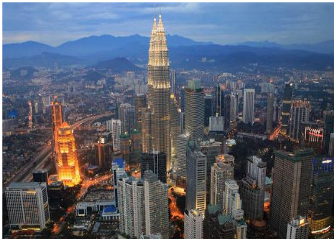
从吉隆坡塔俯瞰全城

马来西亚高速公路网络比较发达，主要城市中心、港口和重要工业区都有高速公路连接沟通。高速公路分政府建设和民营开发两部分，但设计、建造、管理统一由国家大道局负责。目前，马来西亚高速公路网络由贯穿南北的大道为中心构成。