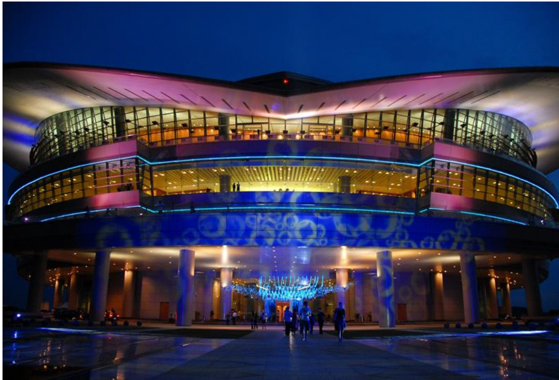
布城PICC国际展览中心