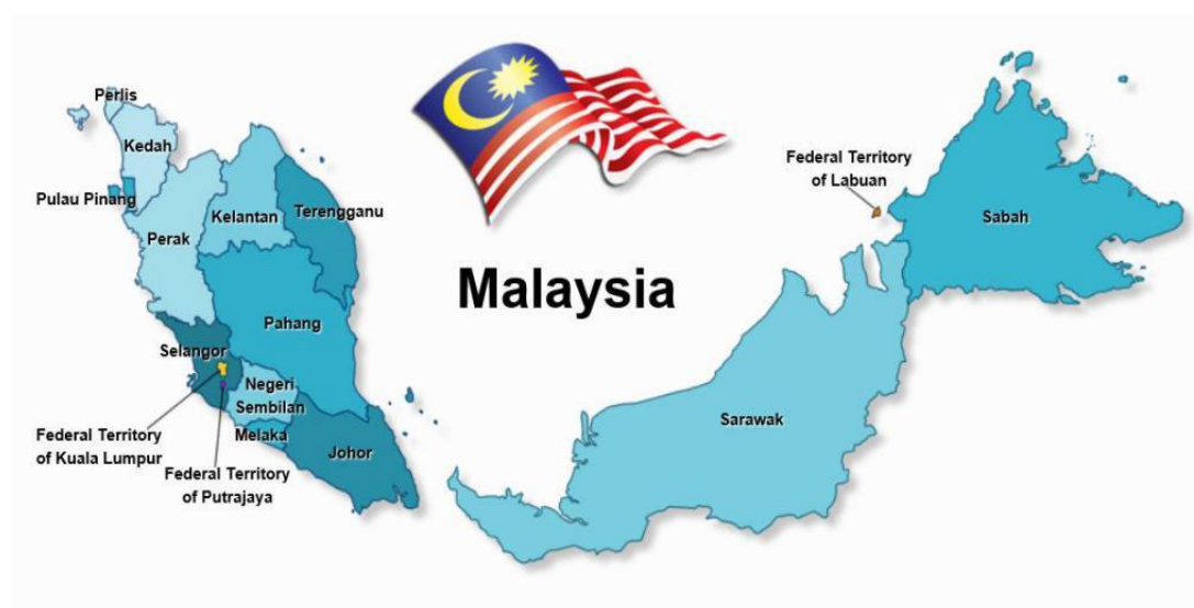
马来西亚行政区划